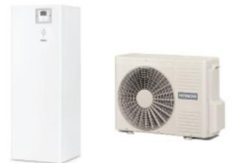
PAC AIR/EAU DOUBLE SERVICE YUTAKI S COMBI