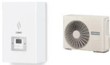
PAC AIR/EAU YUTAKI SPLIT & MONOBLOC CHAUFFAGE SEUL