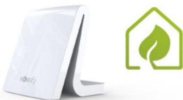
SOLUTIONS CONNECTÉES & REGULATIONS