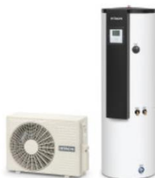
CHAUFFE EAU THERMODYNAMIQUE YUTAMPO