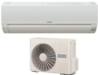
PAC A/A MONOSPLIT & MULTISPLITS